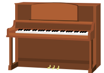
●その他個人消費資金