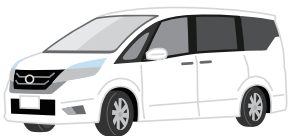
●自動車、オートバイ購入資金